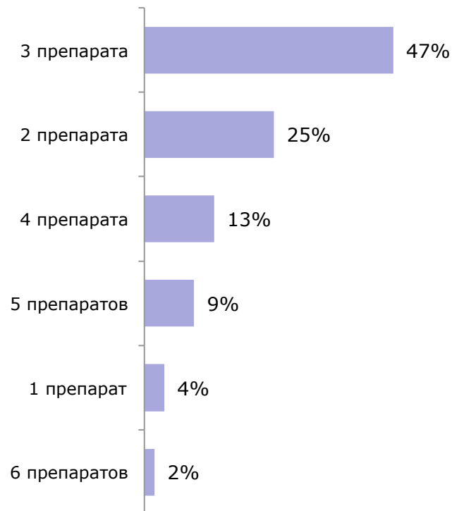
Количество препаратов в схеме терапии БП